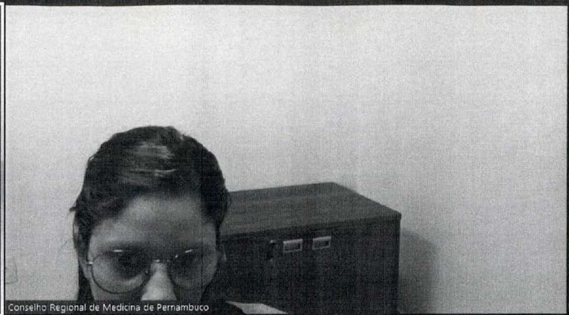
Conselho Regional de Medicina de Pernambuco