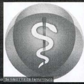
Conselho Regional de Medicina de Pernambuco